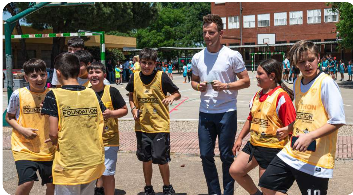
Aleksander Ceferin Presidente de la UEFA