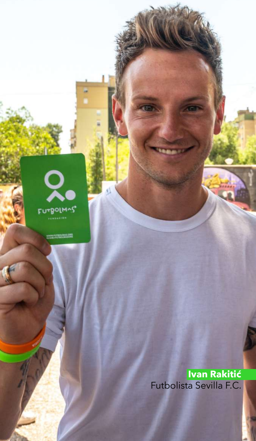
Ivan Rakitić Futbolista Sevilla F.C.