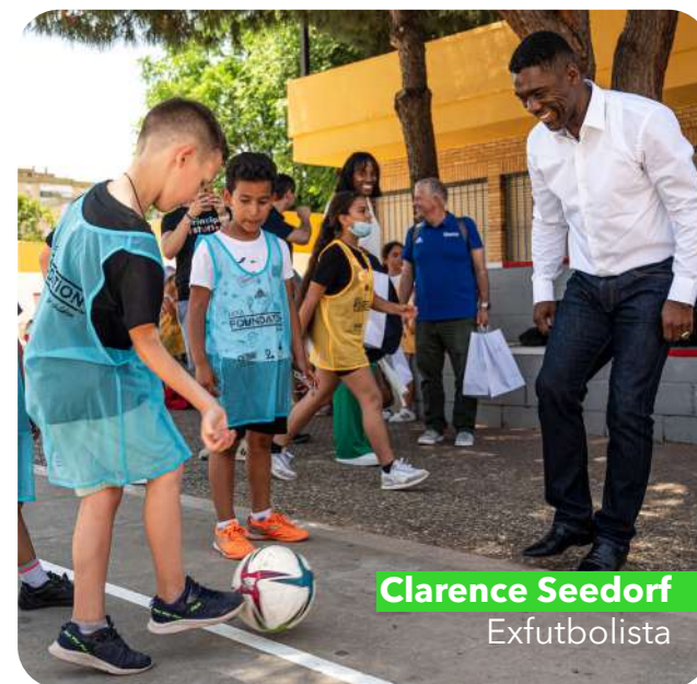
Clarence Seedorf Exfutbolista